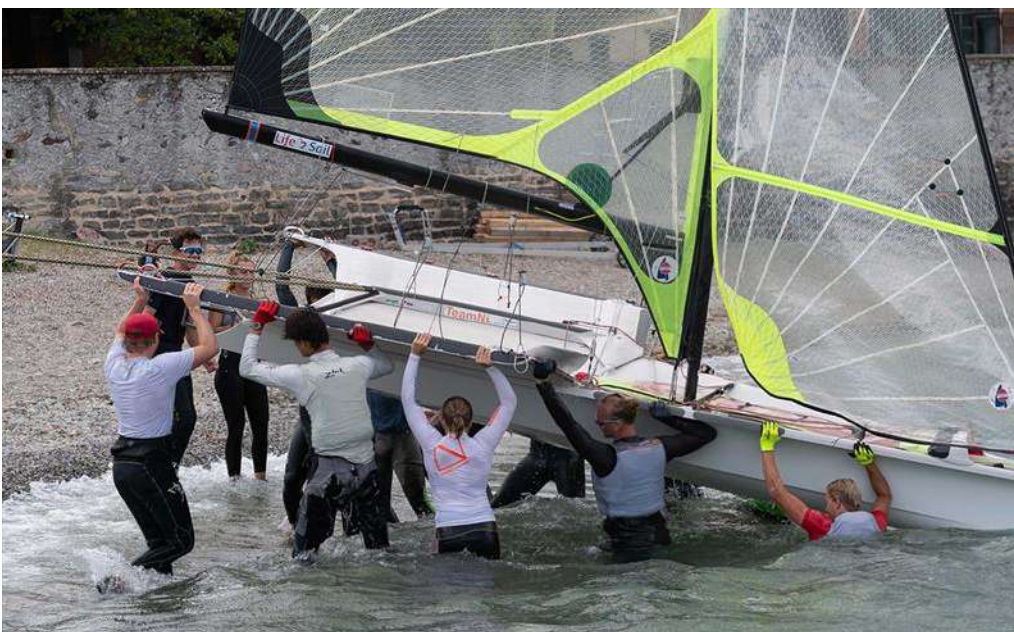
2022 Junior World Championship

Quite naturally, the Junior fleets are always recycling. Teams graduate up to senior levels, others realize the Olympic path might not be for them. Filling the ranks are new teams and sailors ambitious to realize their sailing dreams. Lake Como offered a wonderful and intimate environment for teams get meet and become friendly with one another, starting friendships that may last a lifetime. This bonding was cemented on day four of the championship when stormy weather turned the winds around to the north of the lake requiring upwind launching and retrieving of all 120 49er and FX's.