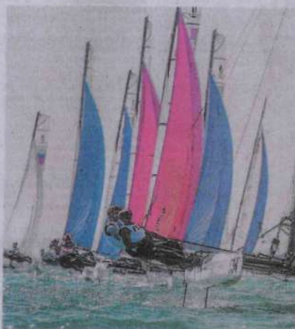
Spettacolari evoluzioni delle barche protagoniste del mondiale

Entrambi i circoli mettono, infatti, a disposizione i loro ampi spazi per alloggiare le barche e svolgere agevolmente le attività a terra, così da gestire una "flotta" formata da ben 135 equipaggi di giovani atleti dai 15 ai 24 anni provenienti da 32 Paesi: Argentina, Aruba, Australia, Austria, Belgio, Brasile, Canada, Croazia, Danimarca, Finlandia, Francia, Germania, Giappone, Gran Bretagna, Grecia, Hong Kong, Irlanda, Israele, Italia, Malta, Norvegia, Nuova Zelanda, Olanda, Perù, Polonia, Portogallo, Repubbli-