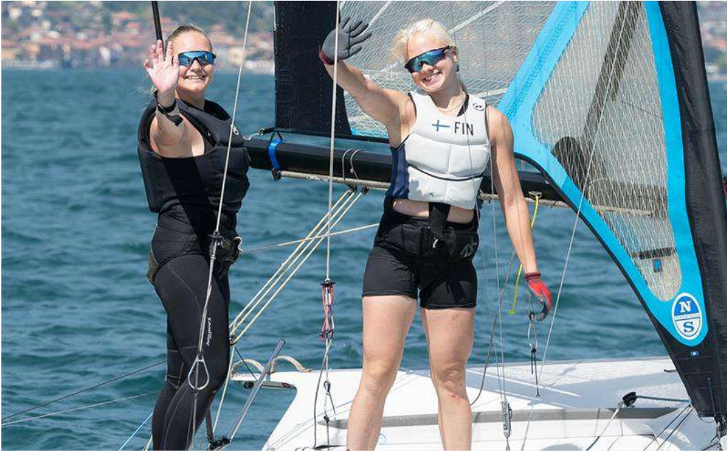
2022 Junior World Championship

The Como multilaro, a six-strong yacht club consortium on lake Como welcomed the fleets on three races areas in one of the most spectacular venues the world has to offer. Crisp azure waters, green mountains, and a reliable daily wind make this a slice of sailor heaven.