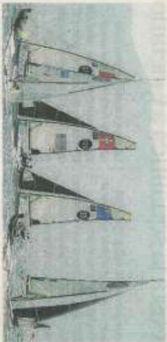
Un momento delle regate di ieri

Cielo sereno, tanto sole e caldo, vento costante. Non si sarebbe potuto chiedere di meglio per il Campionato Mondiale Juniores delle classi olimpiche Nacra 17, 49er e 49er FX, in corso sulle