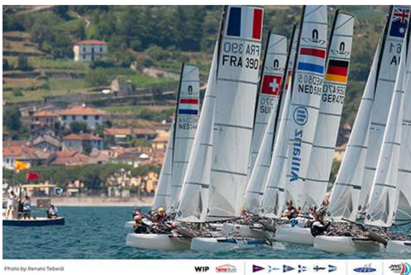
Partenza di una regata della classe olimpica Nacra 17